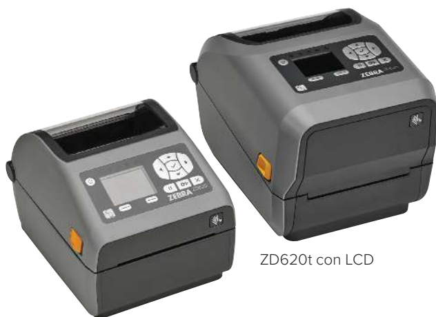
ZD620d con LCD

Cuando la calidad de la impresión, la productividad, la flexibilidad en las aplicaciones y la facilidad de administración son importantes, la ZD620 es la opción. La ZD620 es parte de la nueva generación de impresoras de mesa de Zebra, sustituye las impresoras de la Serie GX y a la ZD500 de Zebra y supera a las impresoras de mesa comunes con una calidad de impresión premium y funciones de punta. La impresora es disponible en los modelos de transferencia térmica directa y térmica, así como modelos específicos para el sector del cuidado de la salud. La ZD620 fue creada para atender a una gran variedad de aplicaciones y proporciona más funciones estándar que cualquier impresora de mesa de Zebra. Con una interfaz opcional de 10 botones con pantalla LCD en color, usted no necesita adivinar la configuración y el estado de la impresora. La ZD620 usa Link-OS® y nuestro poderoso conjunto de aplicaciones, utilitarios y herramientas de desarrollador Print DNA, que ofrece una experiencia de impresión superior con un mejor desempeño, una administración remota simplificada y fácil integración. La ZD620 de Zebra: ofrece la velocidad de impresión, la calidad de impresión y la administración que usted necesita para continuar sus operaciones.