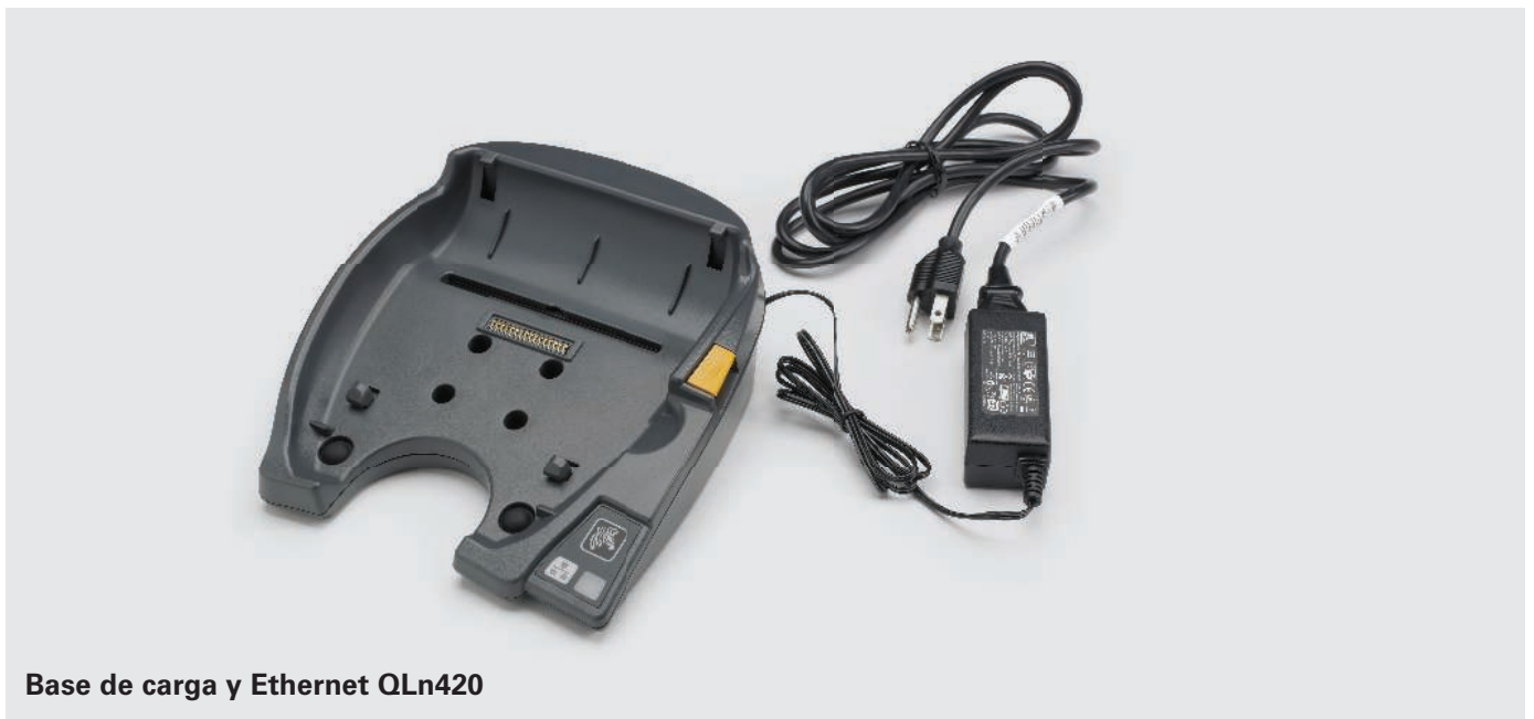
Base de carga y Ethernet QLn420